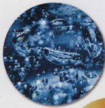
水溶性 コラーゲン (密着型)