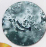
加水分解 コラーゲン (浸透型)