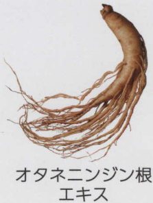
オタネニンジン根 エキス